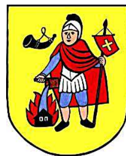
Foto z akcí