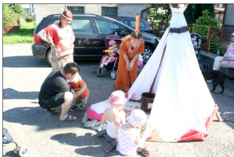
Během stezky byly děti občerstveny