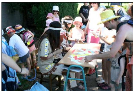
Akce se celkem zúčastnilo 73 dětí, z toho

koláčem z pekárny Lično, pitíčkem od pani Fňoukové z místního obchodu a malým zákuskom indiánka, který vyráběly dobrovolnice z Černíkovice. Na konci trasy si pak mohly vybrat z celé řady cen a samozřejmě nechybělo pár sladkostí na závěr. Poukázku na párek v rohlíku a limonádu zdarma využily téměř všechny děti.