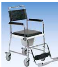
mechanické vozíky, klozetové

vozíky, chodítka, nájezdové rampy, elektrická polohovací postel, antidekubitní matrace, prodej baterií do naslouchadel a jiné