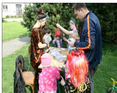
Děti si mj. zaskákaly v pytli, zalovily rybičky,

Dne 30. 4. 2014 se v parku pod školou uskutečnilo dětské odpoledne, které bylo zakončeno táborákem. V tento den se pálí čarodějnice, proto byly všechny soutěže pro děti na jednotlivých stanovištích doprovázeny čarodějnicemi.